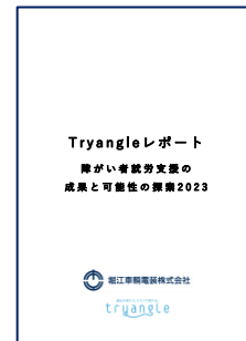
表紙 体裁: A4タテ、12ページ、カラー