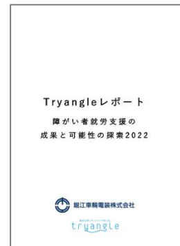
表紙 体裁: A4タテ、19ページ、カラー

堀江車輛電装株式会社は1968年の設立以来、お客様に安全・快適に乗車していただくための車両整備事業と車両改造事業を軸に鉄道車両の発展とともに歩んできました。障がいがあるサッカー選手と出会い、彼らと交流を深める中で、就労意欲があるのに雇用の受け皿がないことなど、障がい者が抱える悩みを知り、障がい者支援事業を2014年に立ち上げました。